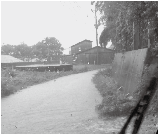
国見町で道路が冠水