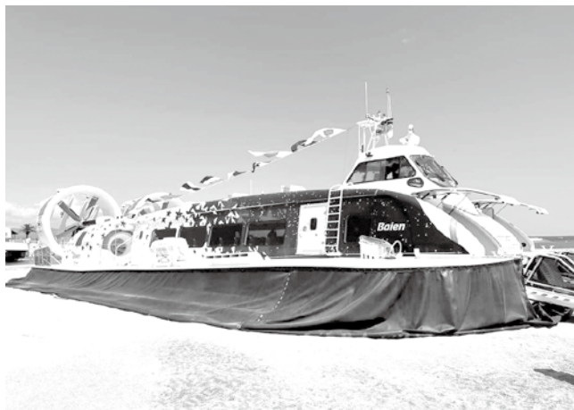
本年度就航するホーバークラフト「Baiken」