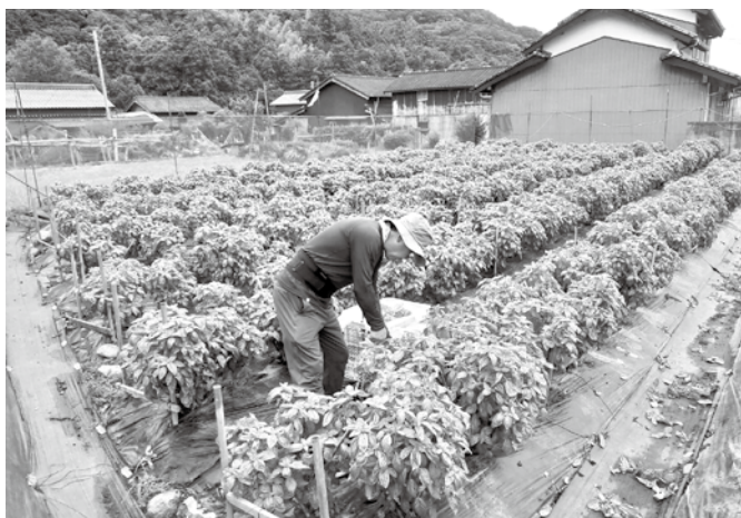
50代新規就農者の農園

る方を含め、小規模農業の方でも、こういった農業をしたいという目標や目的があり、市の農政課にご相談ください。一緒に考えながらサポートさせていただきます。