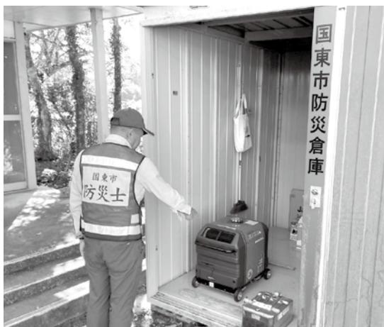
防災士による避難用具のチェック

区長さんと協力しながら、平常時においては、地域の防災に関する啓発活動を行って頂き、災害が発生した場合には、避難誘導などを行うように定めています。あくまでも自発的なボランティア活動と位置付けています。