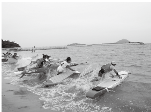
国見海浜公園で行われたサップレース

体験型レジャー施設の立地、設備投資は市企業誘致の助成金の対象となり、これらの立地により地域に新たな魅力が加われば、宿泊を伴う長期滞在型の観光も期待できます。研究・検討課題とし、関係各課と協議していきます。