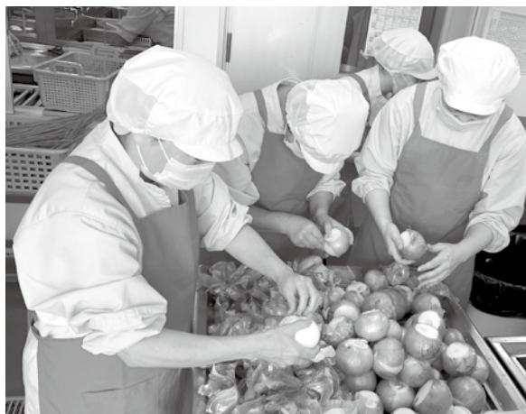
学校給食調理の様子

食材の急激な高騰もあり、物価高騰対策を含め学校給食無償化については、もう少し時間を頂き検討をさせていただきます。