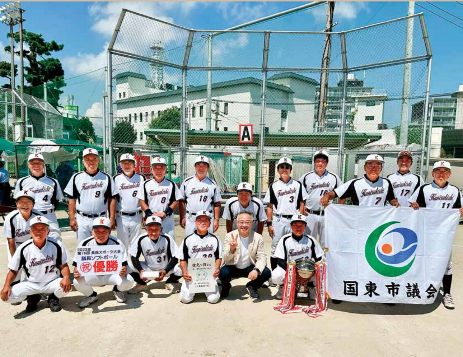
表紙の写真：令和5年大分県民スポーツ大会 議員ソフトボール競技