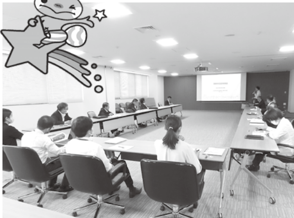
第1回国東市議会勉強会を開催しました

大分空港を宇宙往還機ドリームチェイサーのアジア拠点として活用することを目指し、日本航空、大分県、米国シエラスペース社、兼松によるパートナーシップが締結されました。