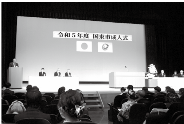
令和5年5月4日に開催された18歳対象の国東市成人式

直近で18歳を迎える方、20歳を迎える方がいますので、そういう方たちに早めにお知らせをする意味で、6月議会ですでに申し上げましたように、二十歳の集いで行わせて頂きたいと思っています。