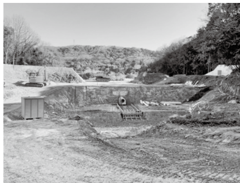
ため池改修の様子

がみられる農業用ため池は、大分県において劣化調査をして選定を行っています。国東市内では、178カ所あり、このうちの18カ所を調査しています。調査結果により、危険度の高い順に県営防災重点農業用ため池の整備事業につなげるということで、地元関係者への提案、協議を行う流れになります