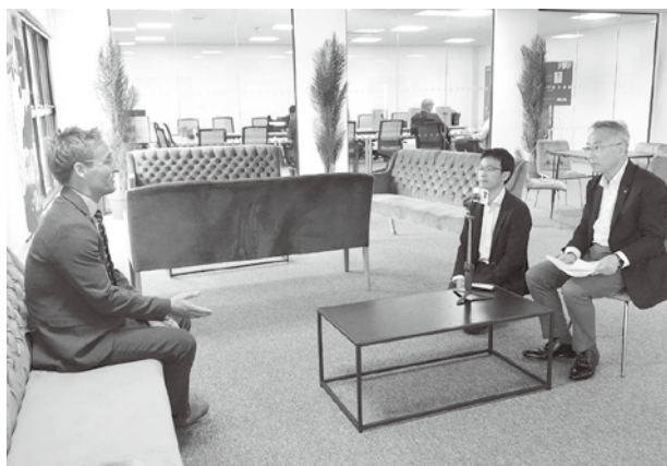
スペースポート コーンウォール 責任者へのインタビュー

市長 宇宙ビジネスの市場は、2040年には約135兆円にもなると予測されており、宇宙ビジネスをまちづくりに取り入れることは、地方創生の観点から大きな可能性がある取組だと考えています。