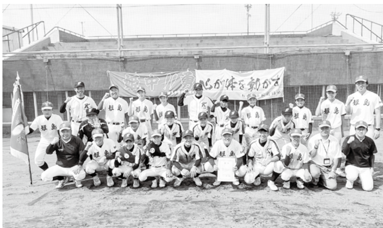
中体連に合同チームで出場